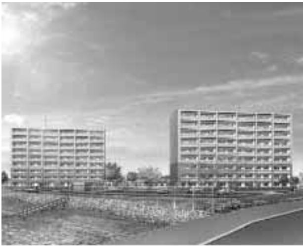
上町南団地 完成予想図