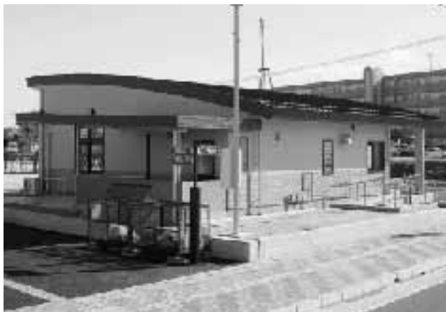
整備が進む赤熊南区画整理事業

今回は平成19年度上半期(平成19年9月末現在)の一般会計、特別会計、公営企業会計の予算執行状況と市債の現在高、市有財産の状況などをお知らせします。