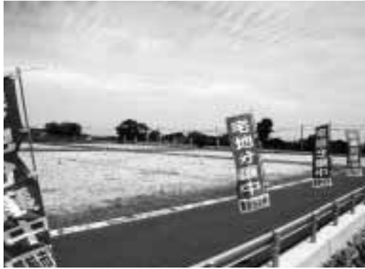
薬師寺・宅地分譲地

平成17年度下半期 市では、市民の皆さんに市政の運営状況等をご理解いただくとともに、豊かで住みよいまちづくりに一層のご協力をお願いするため、財政事情を年2回公表しています。 今回は平成17年度下半期（平成18年3月末現在）の一般会計、特別会計、公営企業会計の予算執行状況と市有財産、市債の現在高などをお知らせします。