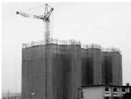
現在建替中の上町団地

平成18年度下半期 市では、市民の皆さんに市政の運営状況等をご理解いただくとともに、豊かで住みよいまちづくりの一層のご協力をお願いするため、財政事情を年2回公表しています。 今回は平成18年度下半期平成19年3月末現在(の一般会計特別会計、公営企業会計の予算執行状況と市有財産、市債の現在高などをお知らせします。