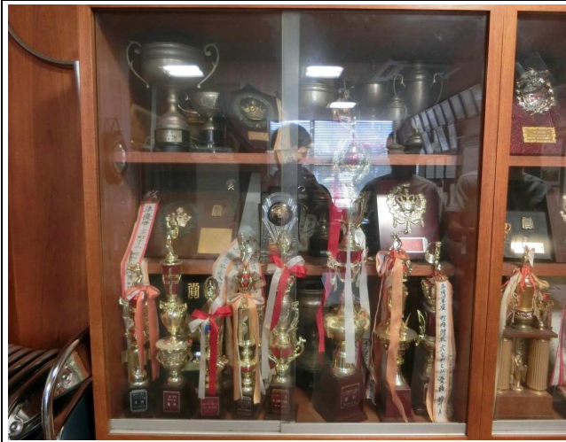
19. 賞状・カップ・トロフィー（上記以外）