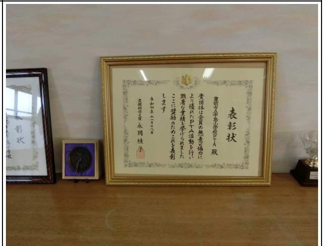
4. 賞状・カップ・トロフィー