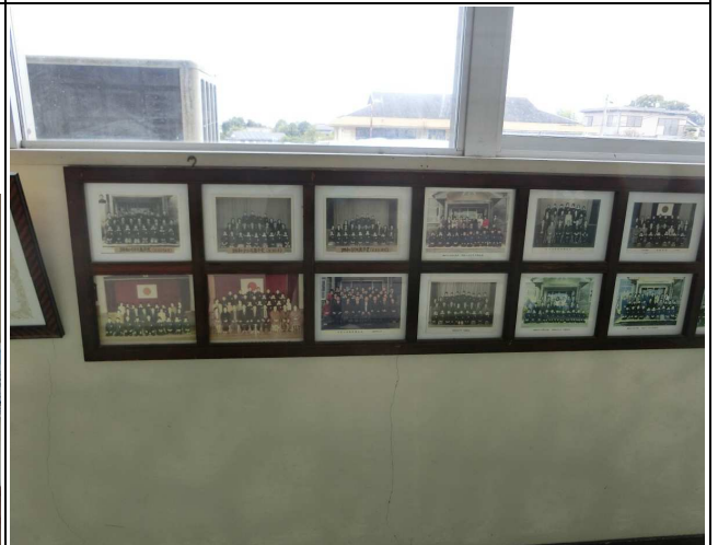
6. 卒業（入学）集合写真