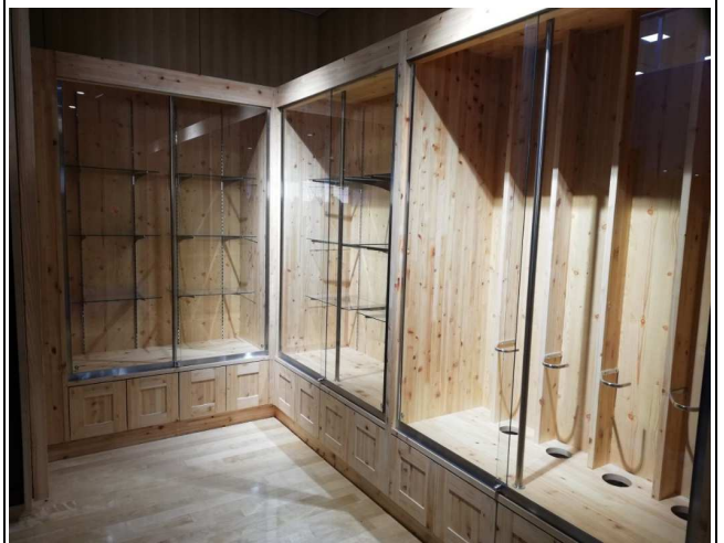
メモリアルコーナー参考