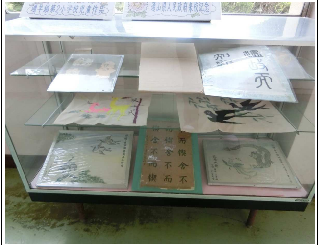
20. 交流先国からの寄贈品