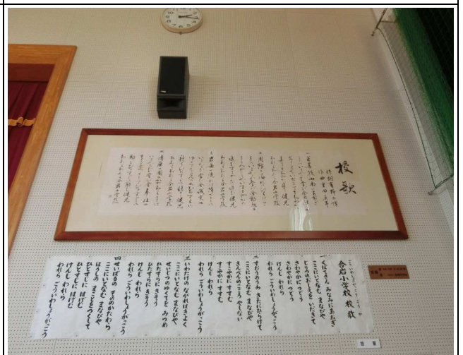
12. 校訓・校歌（体育館掲示）