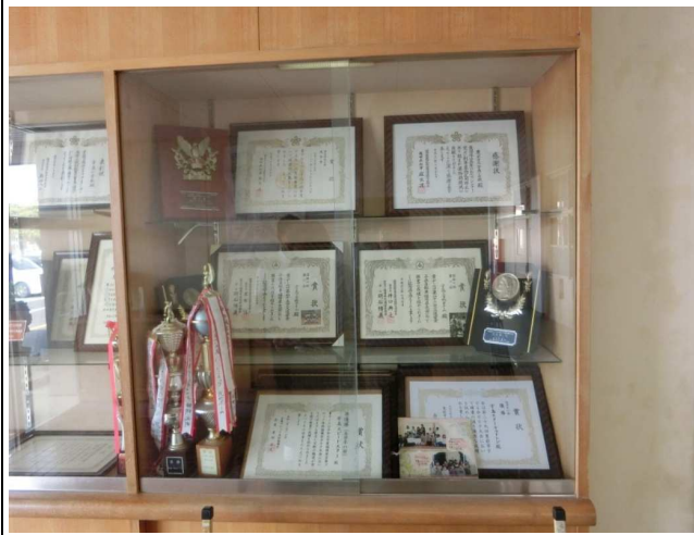
メモリアルコーナー参考