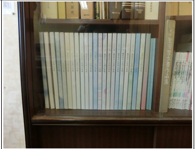
2. 卒業アルバム（冊子）