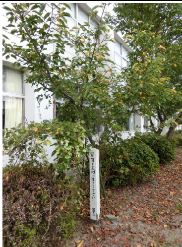
17. 記念樹、記念品（八屋中、角田中）