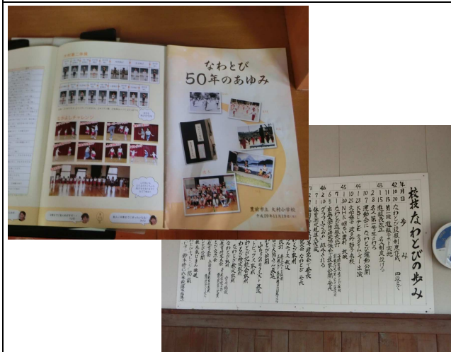
5. 大村小なわとび掲示物、冊子