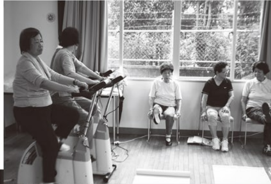
▲ 生き生きエアロ塾