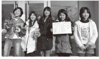
▶角田風お好み焼き

2月12日、みやこ町コミュニティセンターいこいの里で開催された第33回京築ブロック連絡協議会「新春カルタ大会」の小学年の部で角田子ども会の角田風お好み焼きが優勝しました。また、低学年の部では山田子ども会の山田サンダーが準優勝しました。