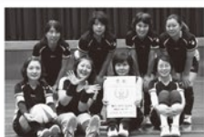
オレンジアタッカーズ