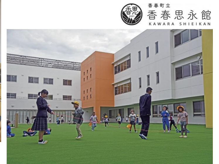
香春町立 香春思永館 KAWARA SHIEIKAN