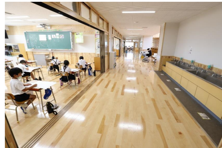
みやこ町立犀川小学校 〒824-0231 福岡県京都郡みやこ町犀川本庄 620 番地 TEL:0930-42-0022 FAX:0930-42-0063

〔 統合小学校においては、現存の施設の調査や設備の配置等の検討など 新設、増設するものに対しては、必要な教室数・設備にあわせた建物等の配置を検討など 〕