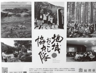
地域おこし協力隊のポスター