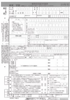
パスポート申請書

秋成議員 人口減少により消滅自治体が増えていくことは間違いない。今後は近隣自治体を手を取り合い、広域行政を考えていく時代になると思うので、豊前市だけが取り残され孤立することがないよう市長にお願いしたい。