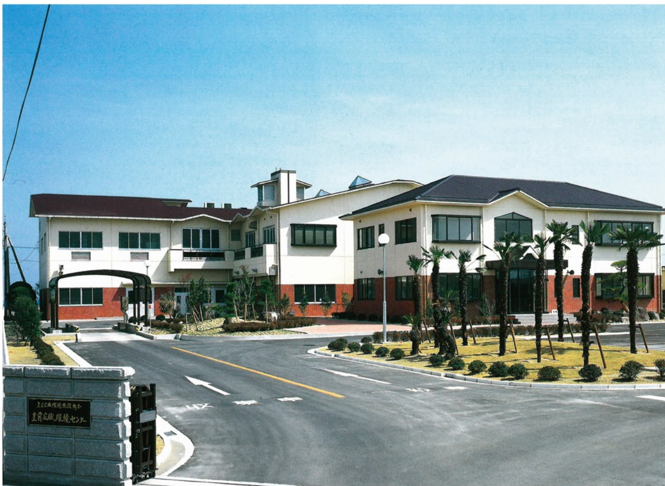
豊前広域環境施設組合

し尿・ごみ処理等生活インフラ調査特別委員会が 設置されました(詳細は13・14ページに掲載)