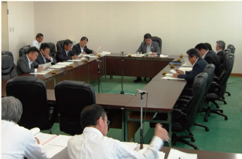
特別委員会開催の様子