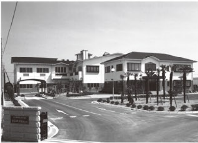
豊前広域環境施設組合

市長 6月議会後、両町に自ら出向き協議を行ったが、費用を見てから判断したいとのことであった。そのため、今後は地元6区の理解を求めながら両町と協議し、早急に実現できるように頑張っていきたいと思う。